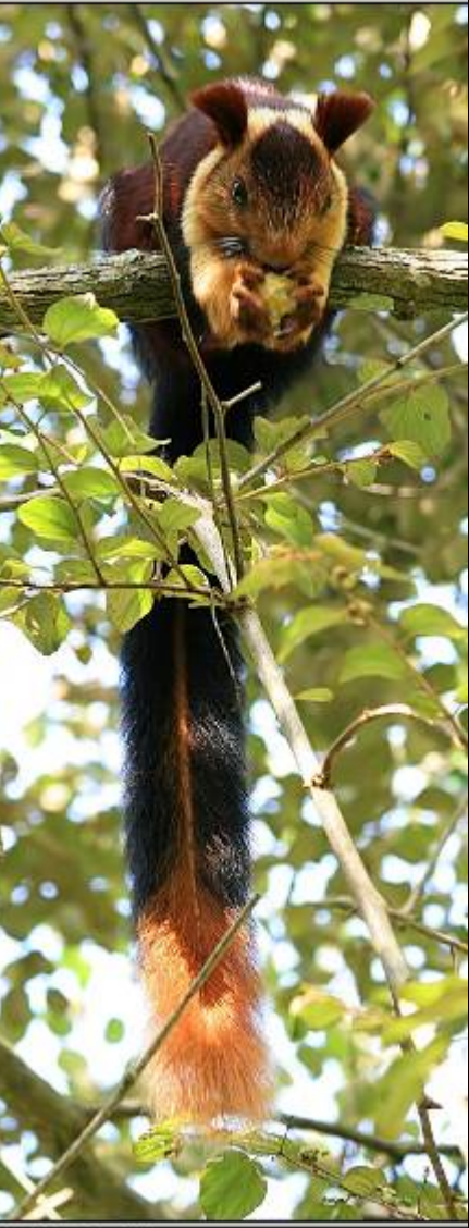
Giant Malabar Squirrel

आमची पिल्ले पण आमच्याभाबूखीच झाडांवरच जळमतात वाढतात नि वापरतात. त्यांच्या वयाच्या आधारेणत ६ महिने ते १ वर्ष पर्यंत आम्ही त्यांना आमच्या शोषत राहू देतो. मग त्यांनी स्वयंपलंथी होऊन स्वतःची झाडं जागा शोधायची. स्वतःचं घर थांधायचं.